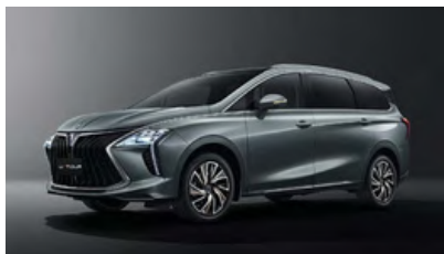
sivá (čierna strecha)