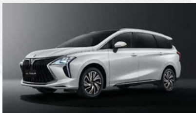
biela (čierna strecha)