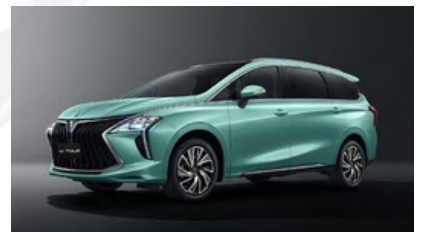
zelená (čierna strecha)